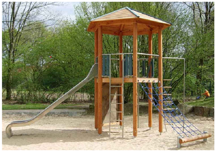
17 Kletterturm Fulda mit vorh. Kurvenrutsche