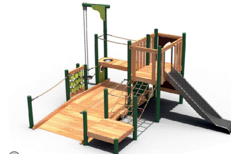
5 Kletterkombination Waldvogel Produktbeispiel Fa. Spielbau