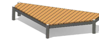
8 Sitzpodest Produktbeispiel Fa. Spielbau