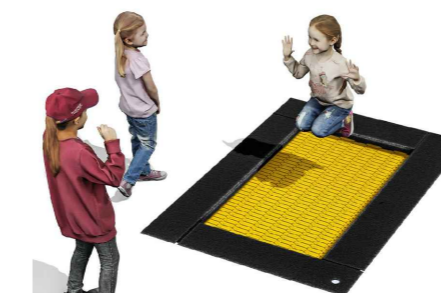
6 Trampolin M Produktbeispiel Fa. srb