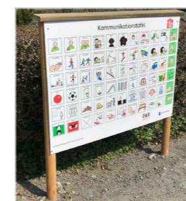
2 Spielplatztafel mit Metacom-Symbolen Produktbeispiel Fa. Aufsmuerverlag