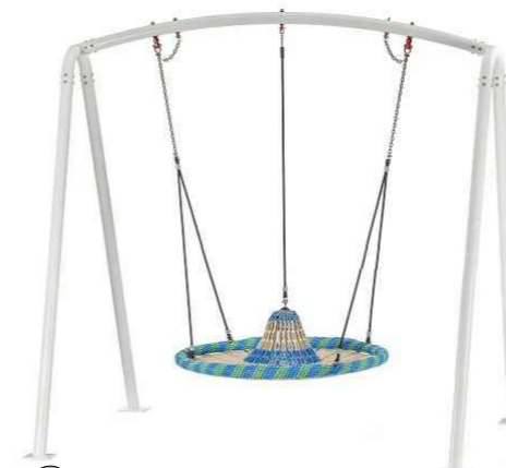
7 Schaukel "Vogelnest Sombbrero" Produktbeispiel Fa. Huck