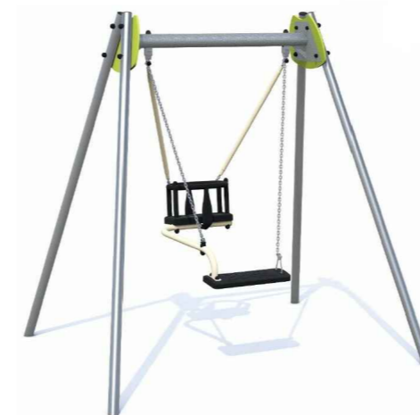
4 Eltern-Kind-Schaukel Produktbeispiel Fa. Protudin