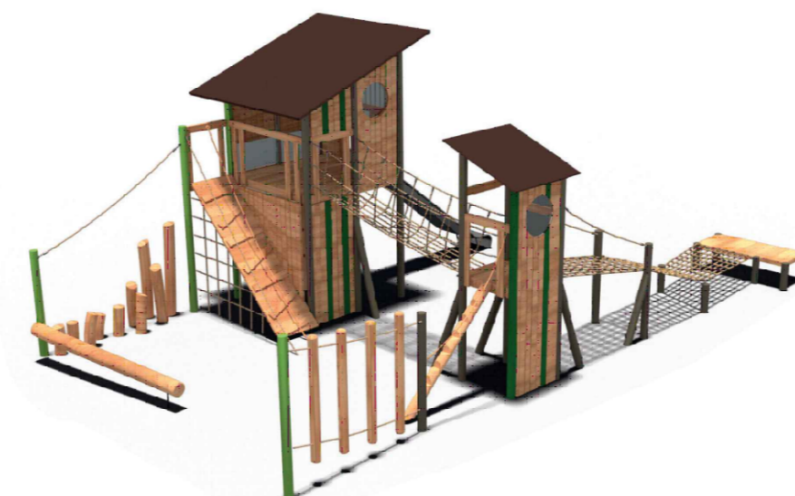
3 Kletterkombination Wald Produktbeispiel Fa. Spielbau